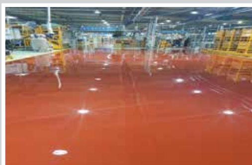
SƠN CẨM THẠCH HỘI TRƯỜNG TRIỂN LÃM