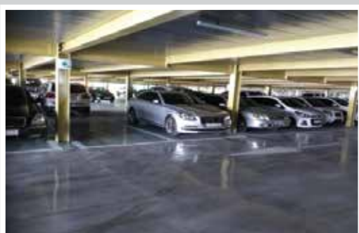
BÃI ĐẬU XE TRONG NHÀ