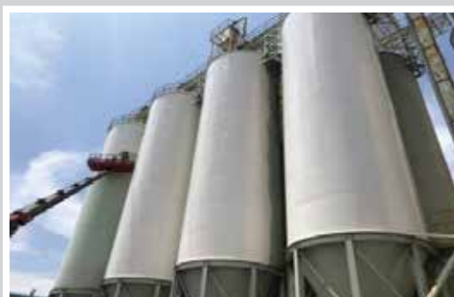
CÔNG TRÌNH NGOÀI TRỜI