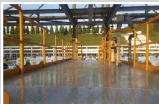
SÀN NHÀ MÁY SẢN XUẤT DẦU