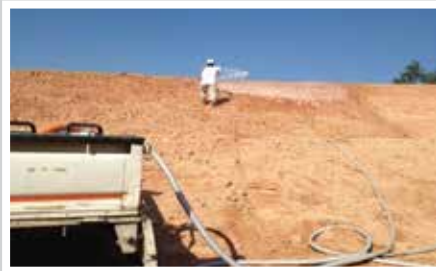
THI CÔNG DỐC