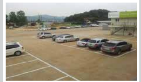
THI CÔNG BÃI ĐẬU XE