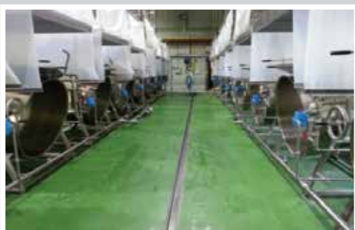
SÀN NHÀ MÁY SẢN XUẤT THỰC PHẨM