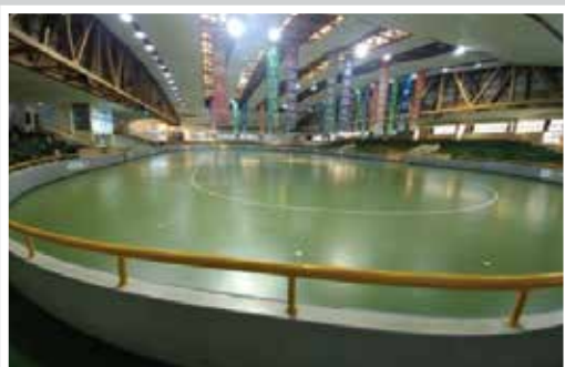
LỚP PHỦ PHÒNG TẬP TRONG NHÀ