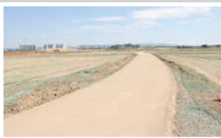
XÂY DỰNG ĐƯỜNG NÔNG TRẠI