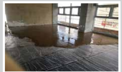
THI CÔNG SÀN NHÀ