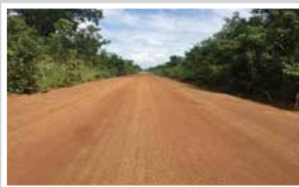
XÂY DỰNG ĐƯỜNG BỘ ĐÔNG NAM Á