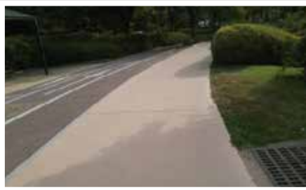
ĐƯỜNG TRẢI NHỰA