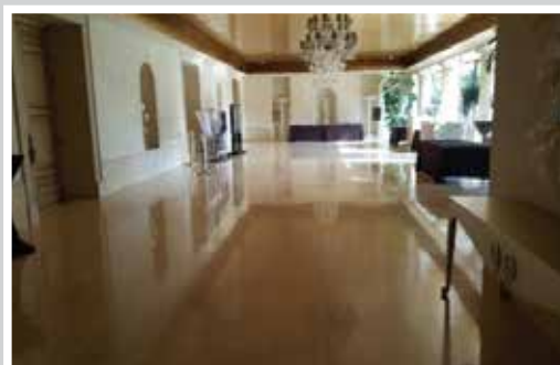
SƠN CẨM THẠCH HỘI TRƯỜNG TRIỂN LÃM